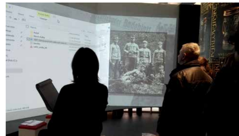
Muzeum Karlovy Vary, instalace audiovizuálních prvků v nové expozici