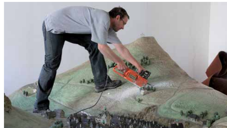
Muzeum Karlovy Vary, repase velkoplošného modelu Karlových Varů