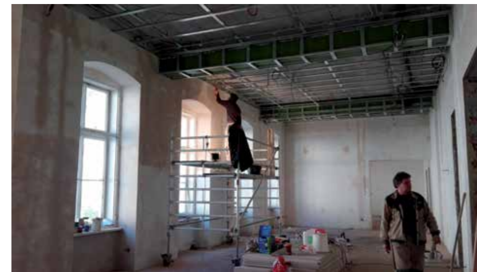
Muzeum Karlovy Vary, umístění repasovaného modelu v nové expozici