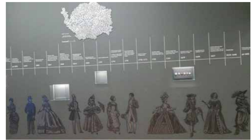
Muzeum Karlovy Vary, řešení výstavní grafiky v nové expozici