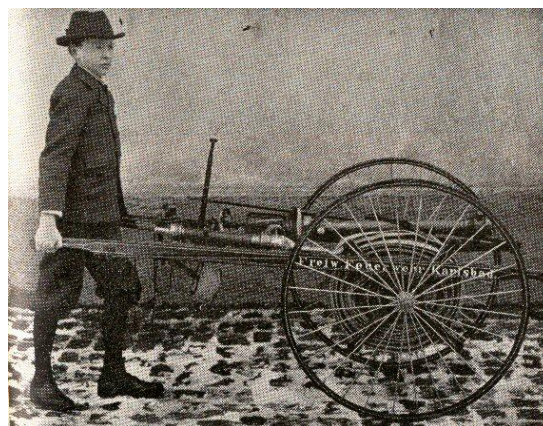
Karlovarský dobrovolný hasič.

Ve tři hodiny ráno 19. dubna 1898 vypukl požár v Císařských lázních. Více než tři hodiny hasiči bojovali s nezkrotným plamenným živlem. Oheň poškodil střechu levého křídla lázní a zadní část věže budovy. Škody na lázních dosáhly čtyřiceti sedmi tisíc zlatých. Kvůli požárům v lázeňských budovách byly v Kaiserbadu (Císařské lázně), v Kurhausu (dnes Lázně III.), v Neubadu (dnes obchodní dům Atrium) a v tehdejší Vřídelní kolonádě zavedeny hasičské hlídky. Z městského rozpočtu se také zaplatil elektrický alarm pro včasné varování obyvatel a lázeňských hostů Karlových Varů.