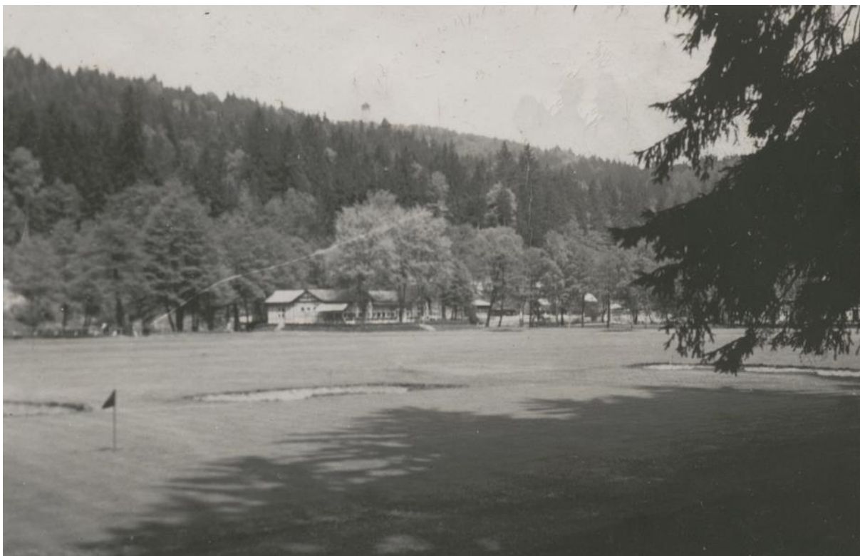
3/ Golfové hřiště Gejzír park před II. světovou válkou