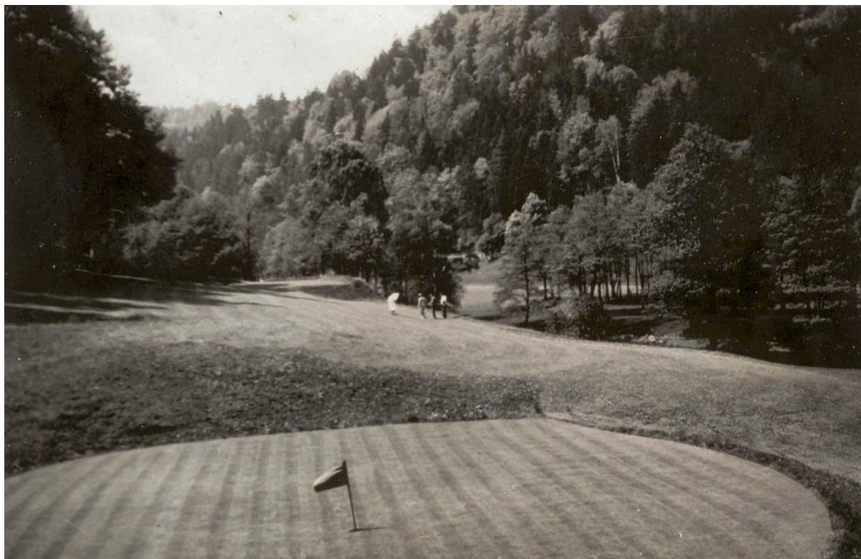
4/ Golfové hřiště v Gerjír parku