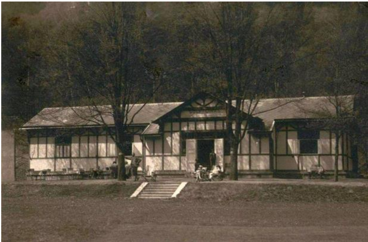
6/ Klubovna v Gejzír parku v meziválečném období