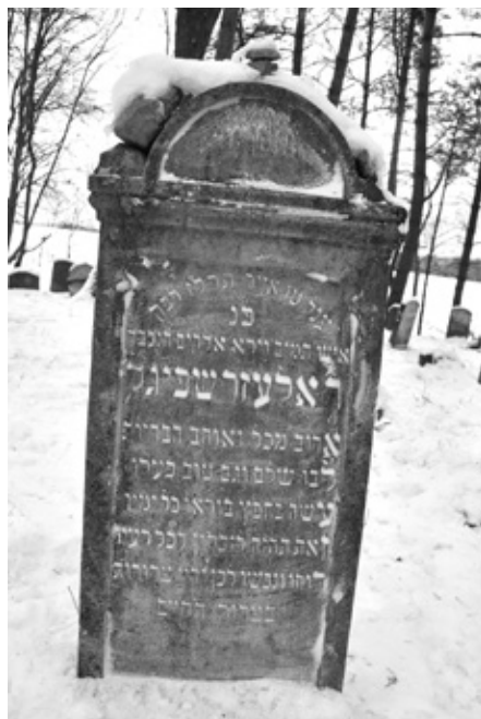
Náhrobek č. 70 Latzara Spiegla – jižní strana.