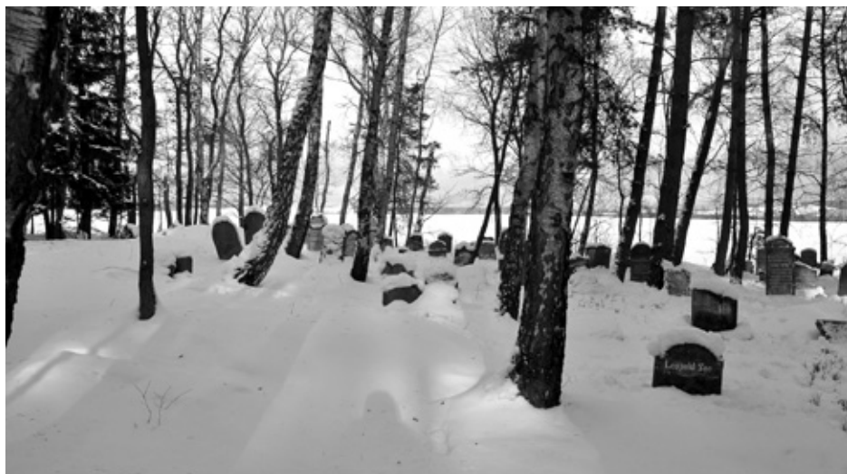
Židovský hřbitov v Lomničce 10. 12. 2010.