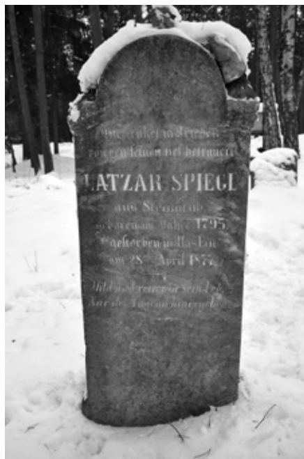
Náhrobek č. 70 Latzara Spiegla – severní strana.

Náhrobní kámen č. 70 se nalézá v sedmé řadě uprostřed hřbitova. Rozměry této stély činí 127 × 47 × 8,5 centimetrů. Horní část je zakončena obloukem, po jeho stranách jsou malé zešíkmené plošky. Pod obloukem je na jižní straně tvarovaná prolomená římsa. Hebrejský text je umístěn v mělkém prostoru. Bilingvní nápis v hebrejštině a němčině se do dnešních dnů zachoval v dobrém stavu.