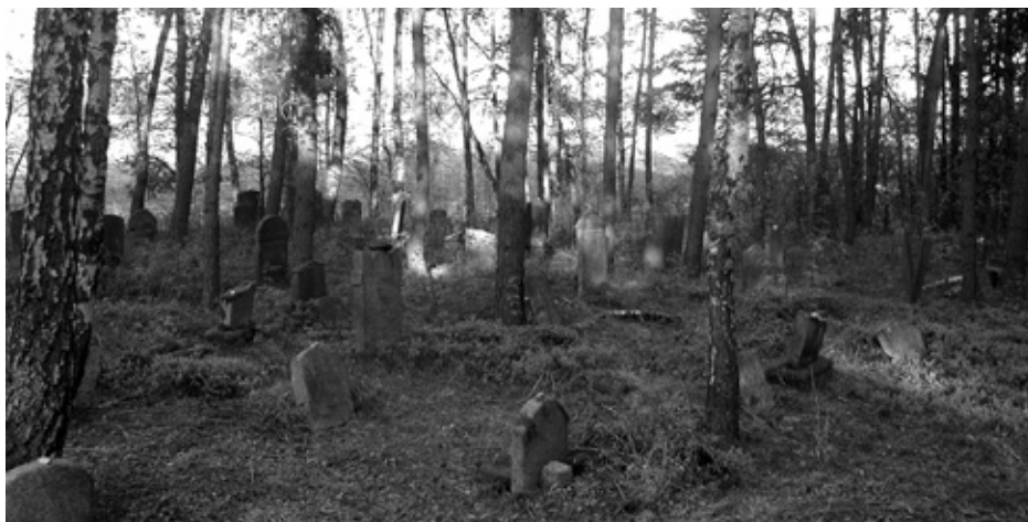
Židovský hřbitov v Lomničce 25. 4. 2009.