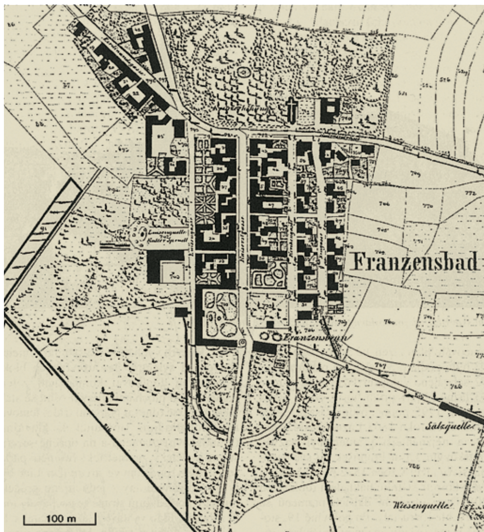
Plán města FL na mapě Stabliního katastru (1841)

byla nedaleko od sebe vybudována nejednou tři hřiště. O tom karlovarském v tehdejším Kaiserparku a hřišti v Mariánských Lázních existuje alespoň několik zpráv, které dokládají založení klubu, výstavbu areálu, jména klubových členů, jejich hlavních představitelů atd. Informace o starém golfovém hřišti ve Františkových Lázních jsou však jen velmi kusé. Pocházejí především z dobového tisku a z částečně dochované korespondence mezi městem, lázeňskou komisí a tenisovým klubem.