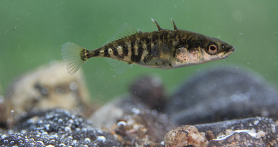
▲ Koljuška tříostná.