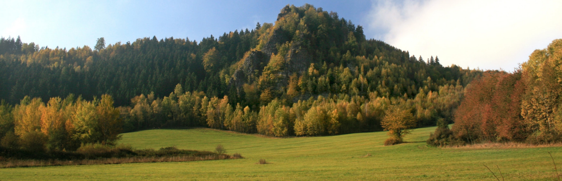
▲ Šemnická skála.