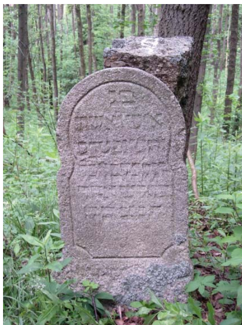
081 – bez identifikace